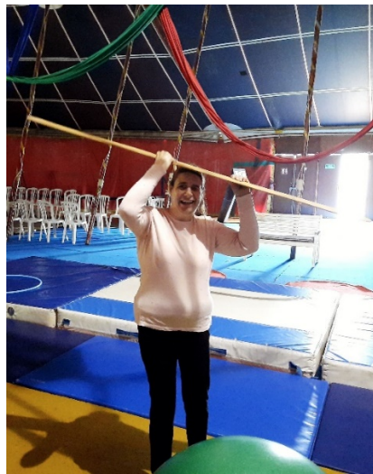
Equilibre d'une planche sur la tête !