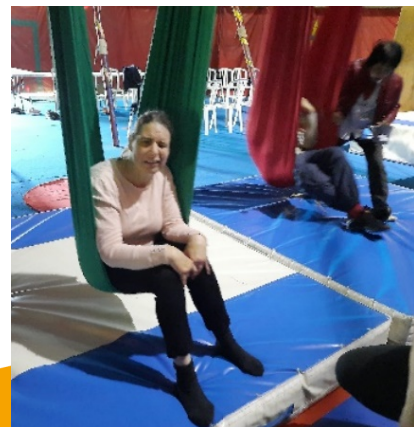
Puis le Hamac, ça, c'est reposant !